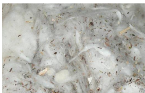
リサイクルコットン

龍田紡績株式会社 (URL http://www.tatsubo.co.jp )